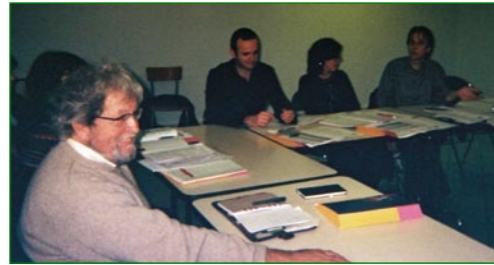
réunion de Valence

Les coordinateurs départementaux informeront les bénévoles lorsque ces formations seront programmées dans leur région. ●