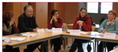
Présentation de l'ARPEJ à Toulouse.

LES RENCONTRES INTERRÉGIONALES de Valence, Toulouse et Metz ont également été l'occasion d'accueillir des représentants locaux de l'ARPEJ (Association Régions Presse Enseignement Jeunesse) afin d'annoncer notre nouveau partenariat en cours d'élaboration. Les coordinateurs Lire et faire lire ont ainsi pu s'exprimer à propos de différentes propositions (dons de journaux, formations à la communication principalement) et établir les premiers contacts pouvant mener à des expérimentations.