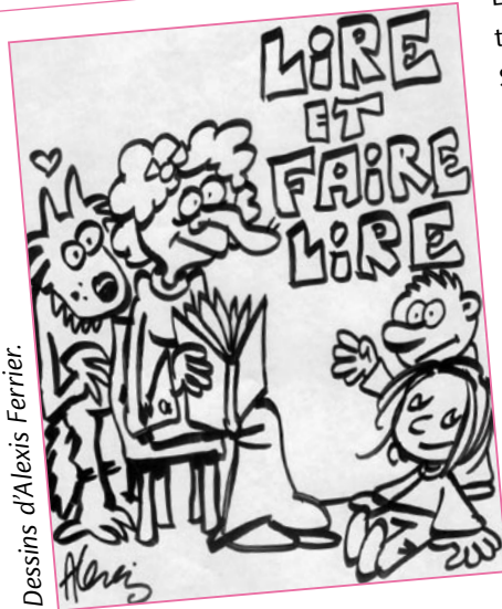
Dessins d'Alexis Ferrrier.

Le grand amphithéâtre de la Sorbonne accueille en juin, le Bilan national annuel de Lire et faire lire. Au-delà d'une manifestation de pure forme, ce moment de réflexion et de convivialité permet de conforter l'élan et l'engagement de réfléchir aux orientations même de Lire et faire lire. Nous poursuivrons donc le travail sur l'organisation des équipes départementales dans le sens du développement d'un projet collectif dans lequel chacun, selon ses envies, le temps dont il dispose, trouverait sa juste place. Nous devons répondre à cette inventivité dont font preuve les quelque 11 000 bénévoles de l'association. Enfin, nous savons, que l'action de Lire et faire lire auprès des publics en situation difficile n'est pas un vœu pieu. C'est maintenant une réalité, source de moments intenses. Poursuivons donc ensemble, avec plaisir, cette action dont l'utilité sociale est une évidence. Et que l'enthousiasme demeure intact !