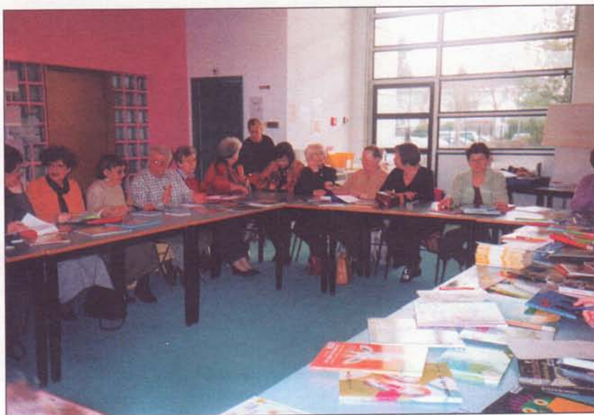
La Médiathèque Départementale de Prêt a ouvert ses portes aux lecteurs et lectrices des Landes

Dans le cadre de son partenariat avec le programme Lire et faire lire, la Médiathèque Départementale de Prêt des Landes a proposé une demie journée de