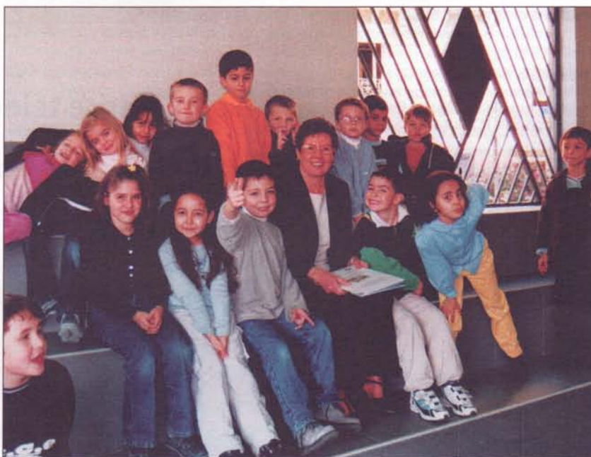
Les enfants monégasques profitent du programme Lire et faire lire