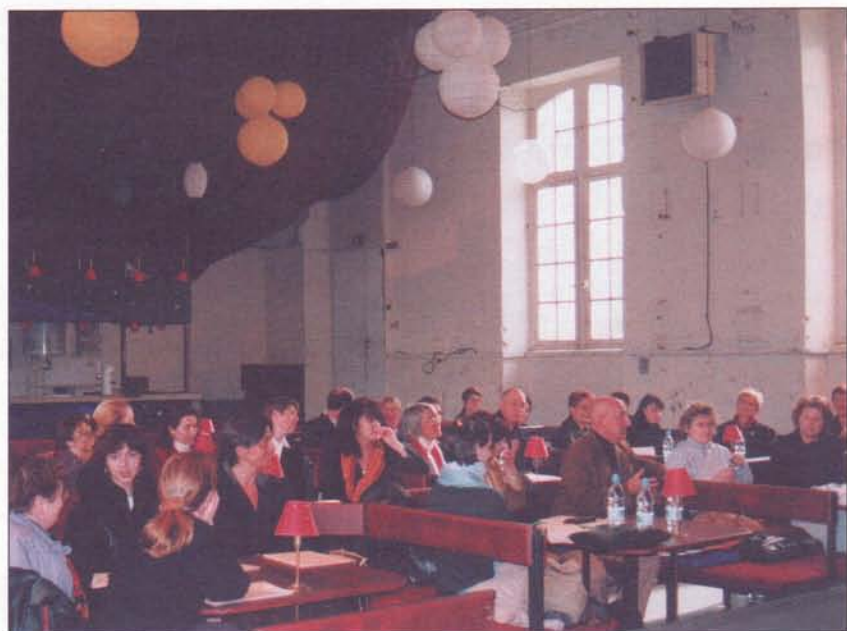
Le Théâtre de la Manufacture a accueilli la rencontre régionale de Nancy