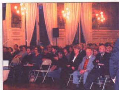
Salle comble à la mairie d'Asnières pour ces premières assises départementales