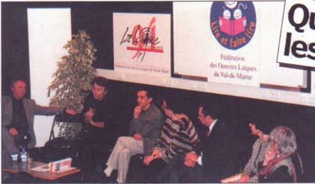
Daniel Pennac entouré par l'équipe de la F.O.L., des lecteurs et lectrices bénévoles et des directrices d'école