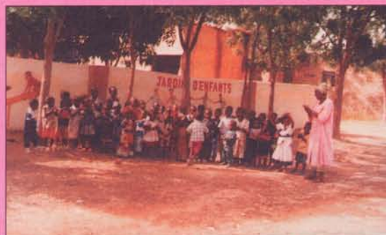
Jardin d'enfant de Kabalabougou au Mali

Promotion du Livre de Jeunesse de Montreuil. Vous pouvez le consulter à l'adresse : http://www.ldj.tm.fr/munari