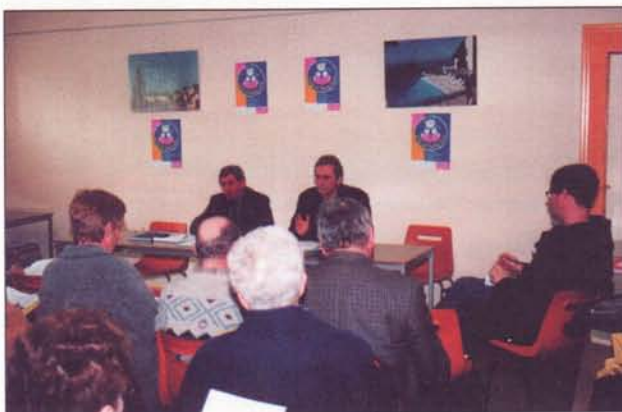
L'assemblée constitutive a rassemblé près de quarante personnes