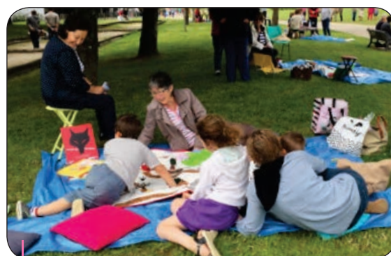
La coordination de la Charente (Udaf et Ligue) a organisé une journée festive au plan d'eau de Saint Yrieix, le 11 juin 2016 : 60 lecteurs présents pour l'apéritif, le traditionnel gâteau et... lectures pour les passants !