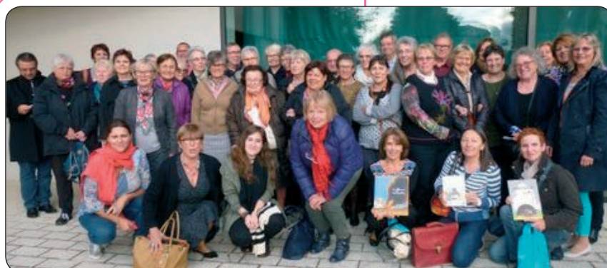
Lire et faire lire du Haut-Rhin a fêté mercredi 19 octobre les 15 ans de l'association avec les bénévoles, les présidents de la Ligue de l'enseignement 68, de l'Udaf 68 et la présidente de Lire et faire lire