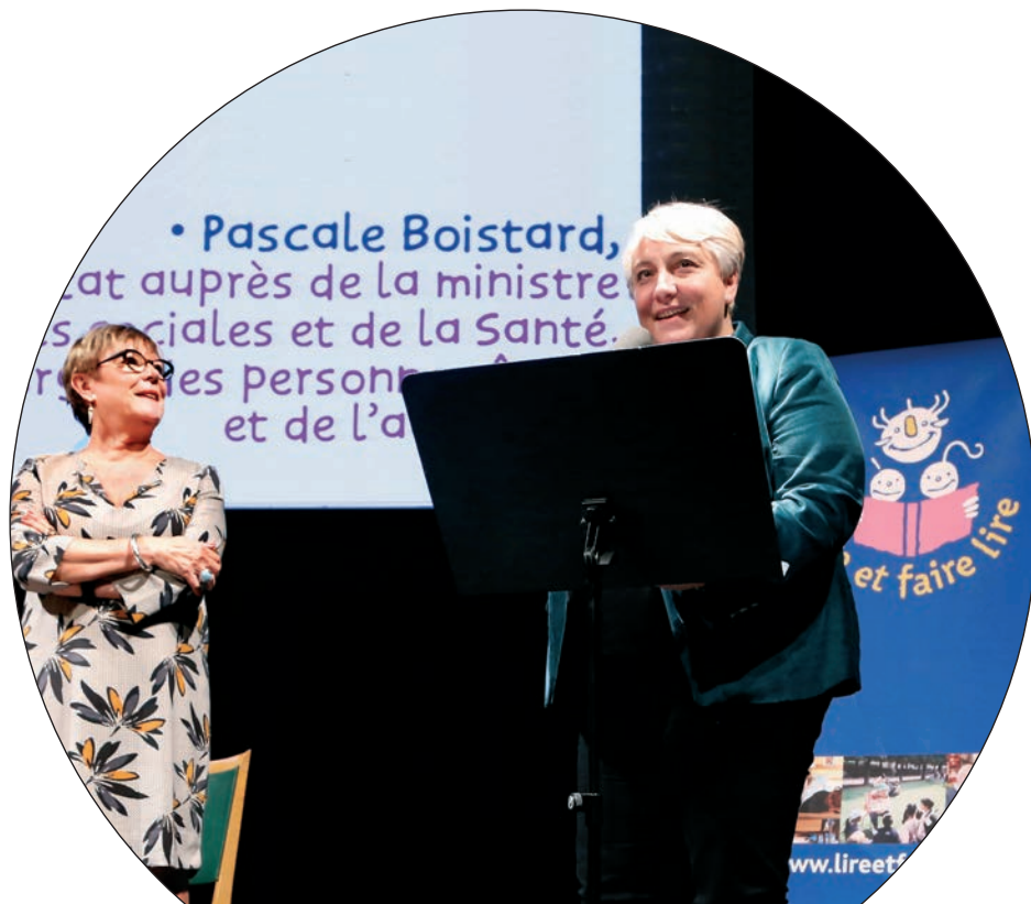
Pascale Boistard, Secrétaire d'État auprès de la ministre des Affaires sociales et de la Santé, chargée des Personnes âgées et de l'Autonomie est intervenue lors du Bilan national pour témoigner de l'intérêt que son ministère portait à l'action de Lire et faire lire. Saluant la mobilisation des bénévoles seniors, elle a tenu à les remercier pour leur engagement citoyen.