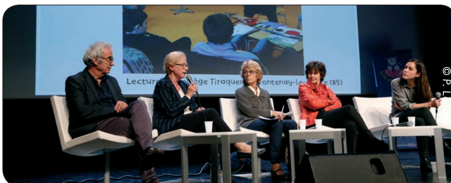
Témoignages des bénévoles intervenant avec les pré-ados

Les enregistrements de ces interventions sont accessibles sur le site internet de Lire et faire lire : www.lireetfairelire.org/content/7eme-colloque