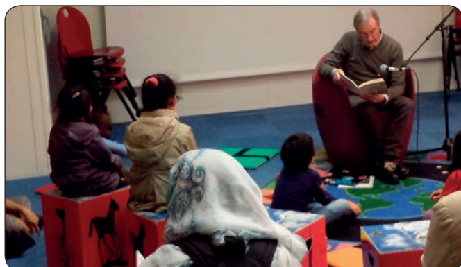
Lecture en salle Shadok de la Cité des sciences et de l'Industrie

À l'occasion de la Fête de la Science, c'est à la Cité des Sciences et de l'Industrie qu'a été lancée l'opération « Je lis la science » les 8 et 9 octobre dernier dans ce lieu approprié à la curiosité scientifique et au plaisir de la découverte.