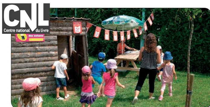
Lectures Lire et faire lire à Viré

Du 20 au 31 juillet, 3 066 animations ont été proposées au public, et plus de 1500 éditions en plus par rapport à l'an dernier. Lire et faire lire était associé à cette grande fête du livre jeunesse notamment avec « Sacs de Pages » menée dans 64 départements. La coordination de la Marne à Reims, Vitry et Epernay a mis à disposition des bénévoles présents les livres de Sacs de Pages. En Saône et Loire, les sacs de Pages ont été