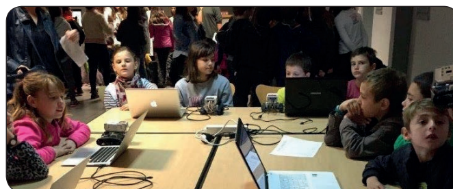
Fête de la science en Haute Corse

En Corse, l'Association Familiale CPIE Centre Corse à Rinascita a coordonné pour la sixième année le Fête de la Science en proposant des nouveautés comme l'opération « Je lis la science » pour éveiller la curiosité des petits comme des plus grands. 180 élèves de CM1 et CM2 venus des écoles de Ghisonaccia, Prunelli-di-Fiumorbu et Travu-Ventiseri ont participé aux différentes animations avec leurs enseignants. Les bénévoles de Lire et faire lire ont présenté l'association, la nouvelle opération « Je lis la science » et proposé des lectures.