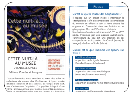
extrait du livret d'accompagnement