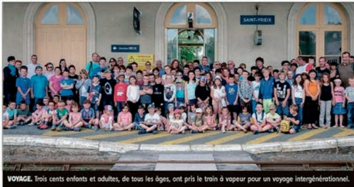
VOYAGE. Trois cents enfants et adultes, de tous les âges, ont pris le train à vapeur pour un voyage intergénérationnel.

Ce train historique est la propriété de l'association Chemin de Fer Touristique Limousin-Périgord qui l'entretient avec passion et le fait fonctionner plusieurs fois par an, depuis plusieurs années. Dans le hall