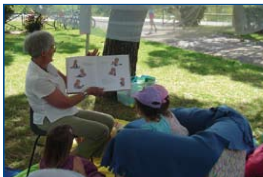
La fête du CEL à Digne-les-Bains (16 juin 2007)