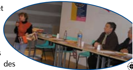
Bibliothécaire (Auch) faisant une présentation de livres pour les tout-petits

Très vite il est apparu que Lire et faire lire était intéressé par les actions de l'axe 2 de notre contrat. Par ailleurs, l'activité de lecture à voix haute que les bénévoles développaient auprès des écoliers cantiliens a largement inspiré la médiathèque qui a créé son propre club de lecteurs amateurs destinés aux adultes pour lire aux adultes au sein de l'axe 3 du contrat. Chacun a nourri l'activité de l'autre, ce qui a permis de jeter les bases d'une coopération plus serrée sans pour autant « instrumentaliser » ou « récupérer » l'activité de l'autre.