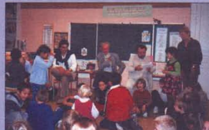
Alexandre Jardin à la rencontre des enfants et des enseignants

7 écoles candidates - 41 intervenants retraités candidats - 16 intervenants retraités actifs affectés aux écoles