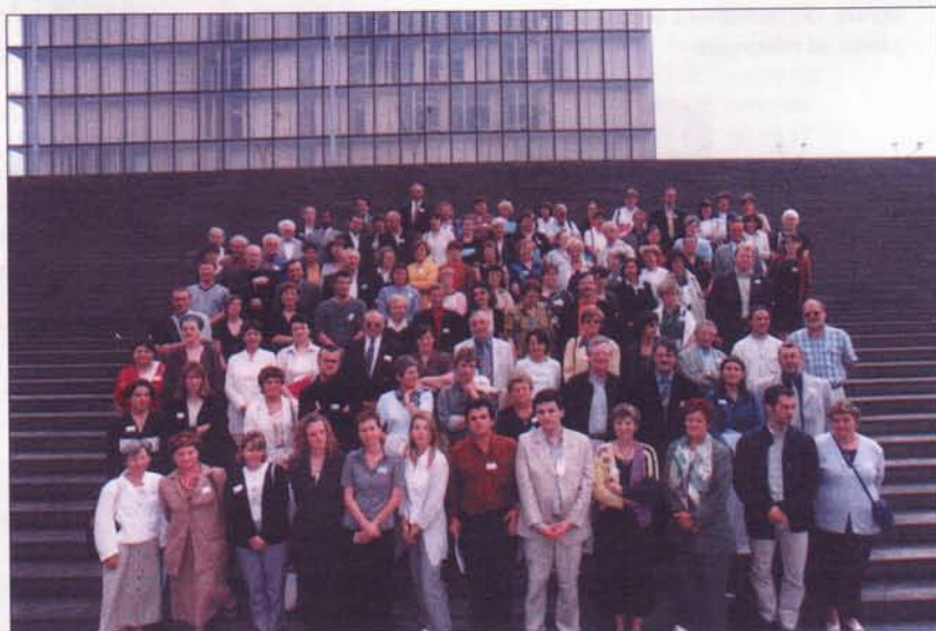
Le réseau Lire et faire lire sur les marches de la Bibliothèque Nationale de France lors du premier bilan national le 15 juin dernier

Aujourd'hui ce sont plus de 60 départements (voir carte en page 7) qui sont impliqués dans le dispositif.... un chiffre qui laisse présager une très belle année