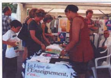
Le stand Lire et faire lire animé par l'équipe de la Ligue 06

Le ciel bleu, le soleil, la chaleur inondaient le Festival du Livre de Nice, ce samedi 1er juillet 2000. Une véritable carte postale et un temps superbe pour aller lézarder sur la plage ou se rafraîchir dans la baie des Anges si proche, et pourtant, un public nombreux se pressait dans les jardins Albert 1er où se tenait le Festival. Durant trois jours les stands furent pris d'assaut par des classes entières de scolaires et tout ce que Nice compte comme amoureux des livres et de la littérature. Le stand Lire et faire lire connut une affluence record. De magnifiques travaux d'élèves réalisés dans des bibliothèques retenaient l'attention des parents et des enfants. Quant aux retraités, ils se firent inscrire nombreux sur les listes de volontaires bénévoles après s'être informés des objectifs de l'association.