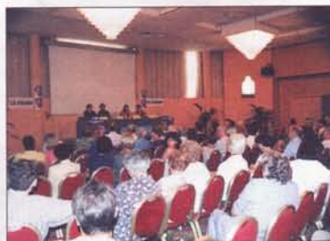
La conférence Lire et faire lire à l'hôtel Piazza