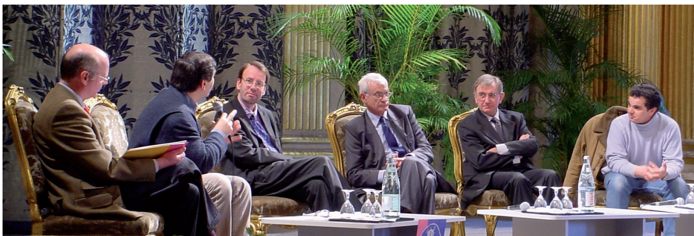
Les élus de Paris accueillent, en présence du recteur d'Académie, Lire et faire lire et ses bénévoles à l'Hôtel de Ville