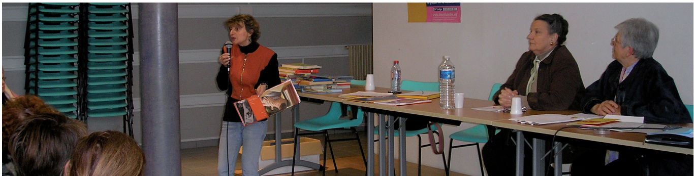
Bibliothécaire (Auch) faisant une présentation de livres pour les tout-petits.