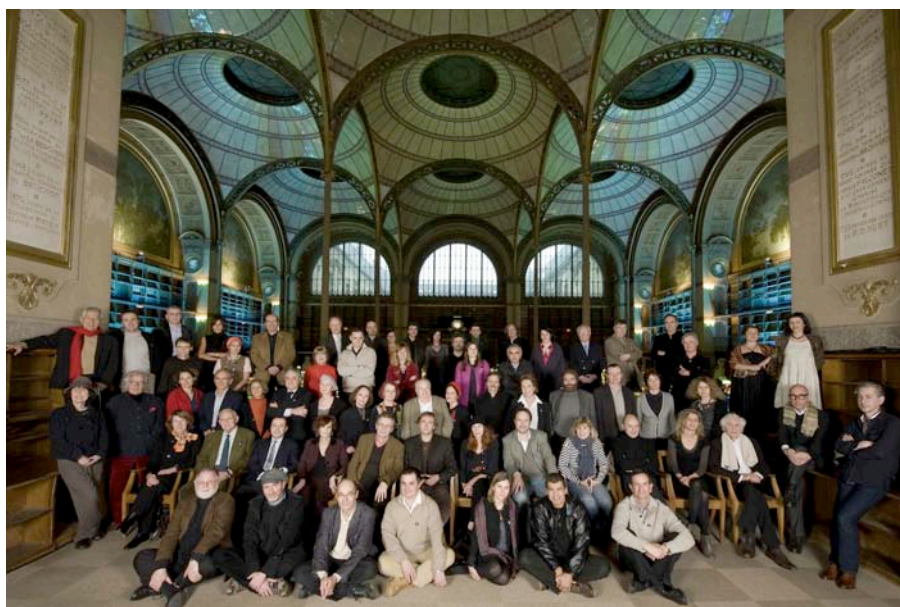
Les écrivains du Comité de soutien posent pour une photo à la Bibliothèque nationale de France à l’occasion des 10 ans de Lire et faire lire (janvier 2010)