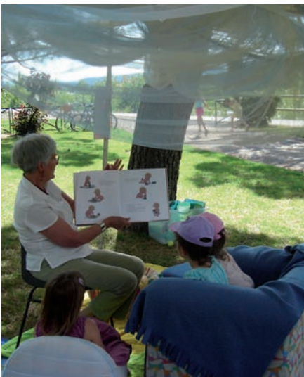
La fête du CEL à Digne-les-Bains (16 juin 2007)

Cette opération permet de resserrer les liens avec les animateurs et directeurs de centres. Ainsi des formations sur la littérature jeunesse ou la lecture à haute voix peuvent être organisées conjointement, les ouvrages sont également fréquemment offerts aux centres à la fin de l'année.