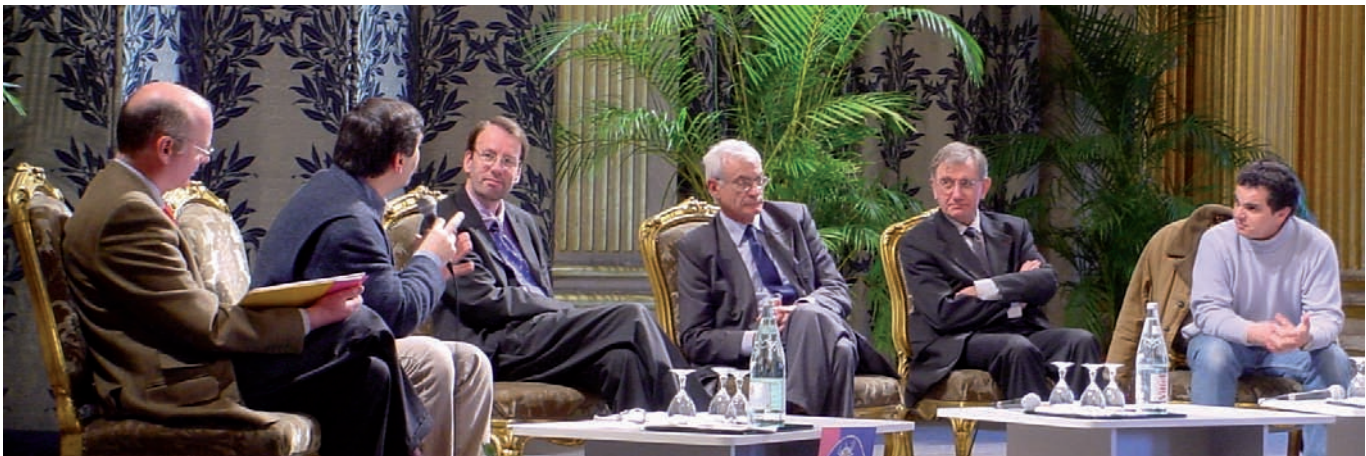
Les élus de Paris accueillent, en présence du recteur d'Académie, Lire et faire lire et ses bénévoles à l'Hôtel de Ville