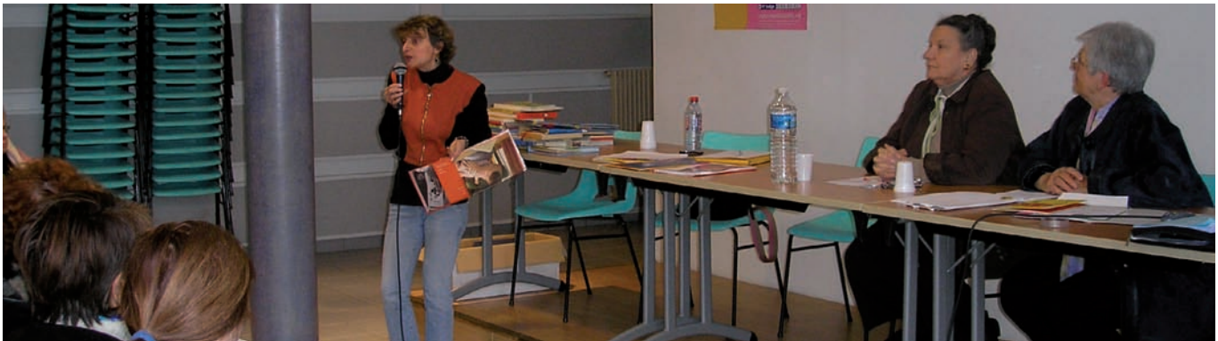
Bibliothécaire (Auch) faisant une présentation de livres pour les tout-petits.