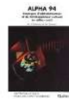
Alpha 94 : stratégies d'alphabétisation et de développement culturel en milieu rural - Dir. Jean-Paul HAUTECOEUR, Hambourg Institut de L'UNESCO pour l'éducation, Ministère de l'Education, 1994