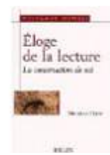
L'éloge de la lecture ou la construction de soi Michèle Petit (Belin, 2005)