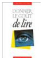
Donner le goût de lire Christian POSLANIEC (Édition du Sorbier, 2001)