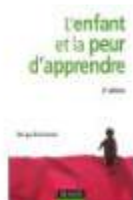
L'enfant et la peur d'apprendre - Serge BOIMARE - Dunod / 2003