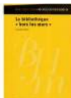
La bibliothèque hors les murs Claudie TABET. Ed. Cercle de la librairie (collection bibliothèque), 2004