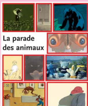
La parade des animaux